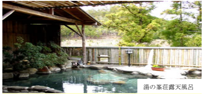
湯の峯荘露天風呂